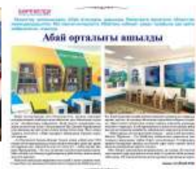
Рухани-танымдық қалыптастыру кітап оқу